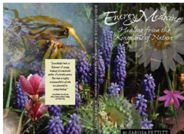
Boek: Pacific Energy Medicine.